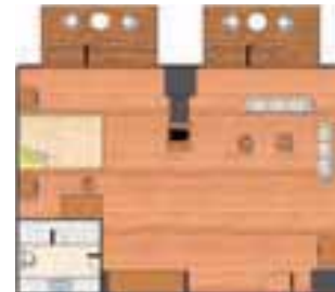
Junior Suite Superior